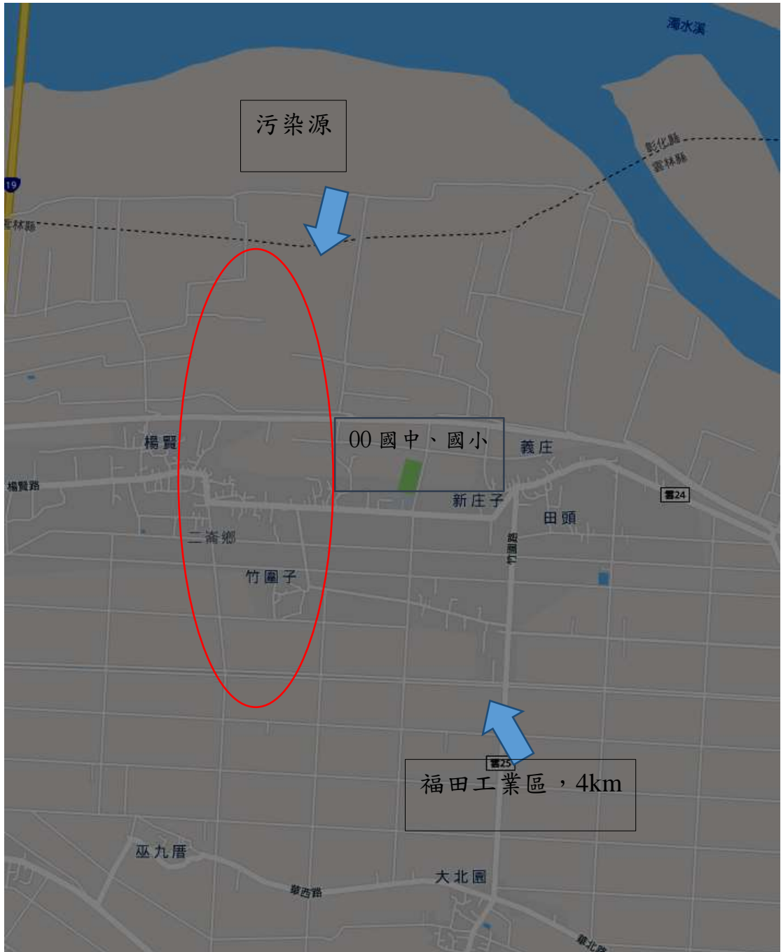
圖1 學校區位關係示意圖案例